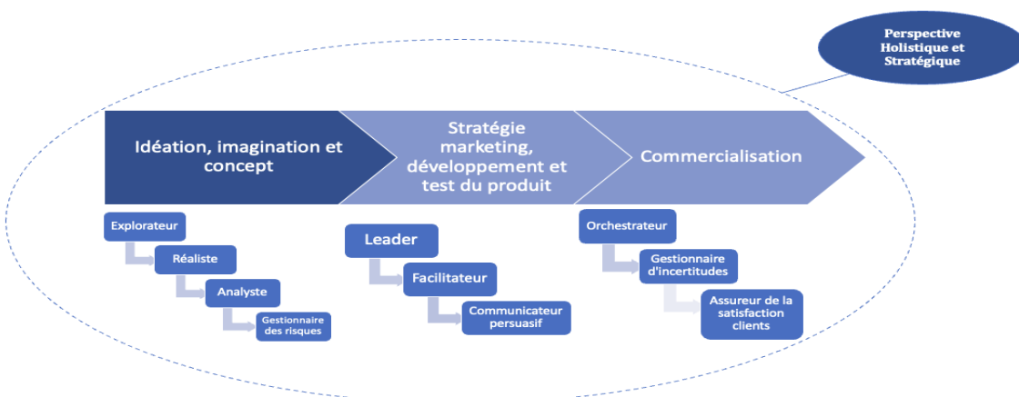
Figure 2 : Rôles du service des achats dans le processus de DNP

Concernant les apports managériaux, nous nous sommes inspirés du modèle développé par Koen et al, (2002) qui se scinde en trois étapes (figure 2). La première concerne la génération d'idées et l'exploration de nouvelles opportunités. La deuxième inclut la stratégie marketing, le développement de prototypes et les tests pour s'assurer que le produit répond aux attentes des clients. La troisième étape se concentre sur le plan de lancement, la distribution, la tarification et la communication avec les clients.