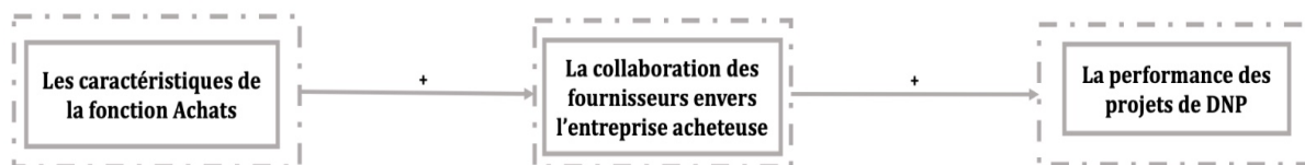
Figure 1 : Redéfinition de la collaboration

Cette étude propose une redéfinition de la collaboration, offrant des implications spécifiques au contexte français. Plutôt que de se limiter à l'influence de l'entreprise sur le fournisseur, cette recherche suggère que le statut du service des achats peut orienter et influencer positivement la collaboration du fournisseur envers l'entreprise acheteuse. Cela permet d'éviter une perspective unilatérale centrée sur l'entreprise, soulignant l'importance de l'engagement des fournisseurs dans le processus d'innovation. Cette nuance dévoile des dynamiques particulières, notamment dans le cadre d'appels d'offres, fournissant ainsi une vision plus précise sur l'importance de la perception et de l'engagement du fournisseur dans le processus de DNP. Au-delà des constats déjà établis, cette étude expose deux contributions théoriques.