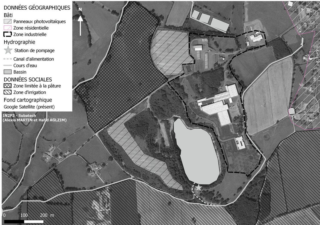
Fig. 3. Usages contemporains.

sont définis. La partie de la mine à ciel ouvert est remblayée avec des produits issus de l'assainissement et les résidus de lixiviation. L'ensemble des produits sont recouverts par un lit de calcaire d'une dizaine de centimètres d'épaisseur. La partie nord est comblée par des stériles miniers. La prise en compte des pratiques est majeure car sur le site, une controverse se développe au début des années 2000 autour de l'usage du bassin d'eau. En effet, un groupement de 16 exploitants agricoles l'utilise, alors que sur d'autres sites miniers, ces zones contenant des résidus sont considérées comme des installations classées pour la protection de l'environnement (ICPE). Au sein de la commission interdépartementale présidée par le préfet, qui se met en place à partir de 2009 pour gérer le site, les éléments liés aux impacts environnementaux sont cités ainsi que les éléments juridiques qui encadrent le stockage des résidus. Une gestion environnementale alignée sur la politique nationale est demandée par l'association locale de défense de l'environnement, qui de fait souhaite défendre une mise en œuvre cohérente avec l'ensemble des textes juridiques. Ce point est mis en discussion au sein de la commission interdépartementale, qui met en avant la nécessité de s'appuyer sur des analyses in situ. Une controverse s'installe entre l'association et les représentants des services de l'État qui s'appuient sur les usages du site et sa reconversion pour maintenir l'existant.