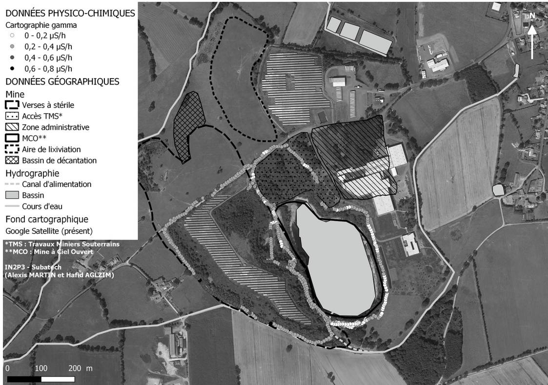
Fig. 2. Mesures et usages passés. Les résultats détaillés sont disponibles dans Martin et al. (2019) .

dangerosité. Les traces que l'on peut rencontrer sont plutôt associées à des contaminations diffuses issues des termes sources et/ou à des contaminations issues de la période d'exploitation. Mais il est important de rappeler que l'on se trouve dans des environnements renforcés en radioactivité, et que des phénomènes complètement naturels peuvent conduire également à des processus de concentration et donc à des « anomalies » si l'on compare au fond géochimique 5 , dont on distingue la part « naturelle » (transformation de la roche et apports naturels) et la part « anthropique » (présence d'éléments due aux activités humaines).