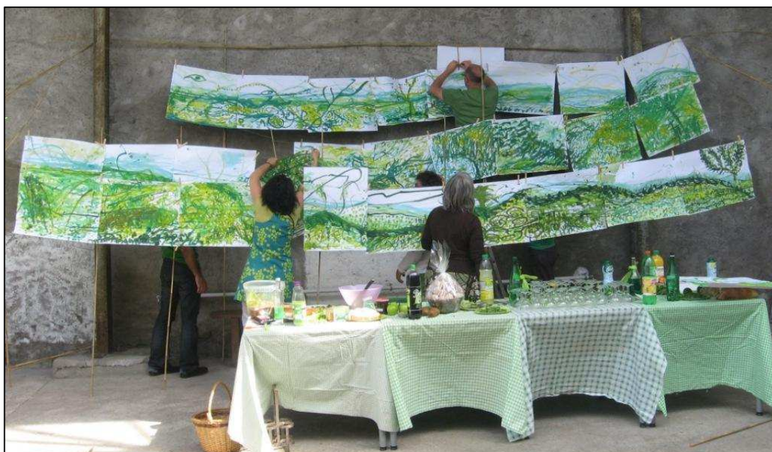
Figure 1 : Fresque co-créeée par les contributeurs et La Luna, collectif de plasticiennes.